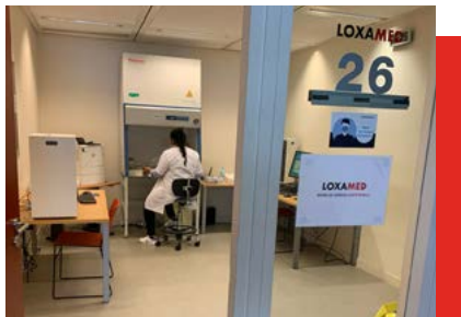
Laboratoire Loxamed - Air France