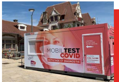
Module Mobiltest - La Baule-Escoublac