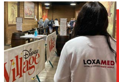
Centre de dépistage - Disneyland Paris