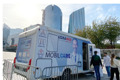
Véhicule (sur plusieurs sites)